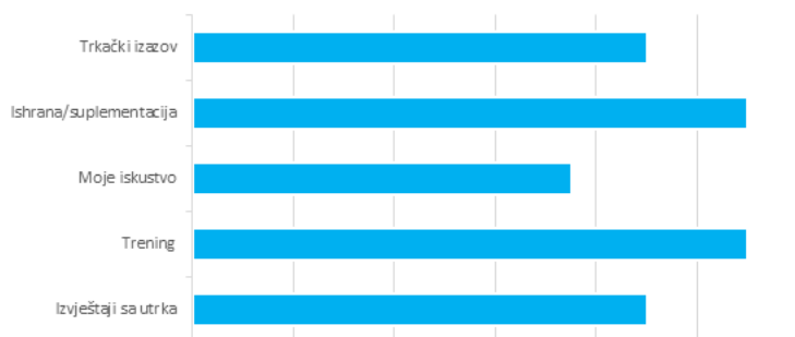
Najposjećenije rubrike na portalu Moje trčanje - trcanje.net

Portal nastoji promovirati sportske vrijednosti, zdrav život i spaja ljude širom regije (zemalja Balkana) pa s ponosom možemo istaknuti da je ujedno i najčitaniji u regiji od specijaliziranih za trčanje.